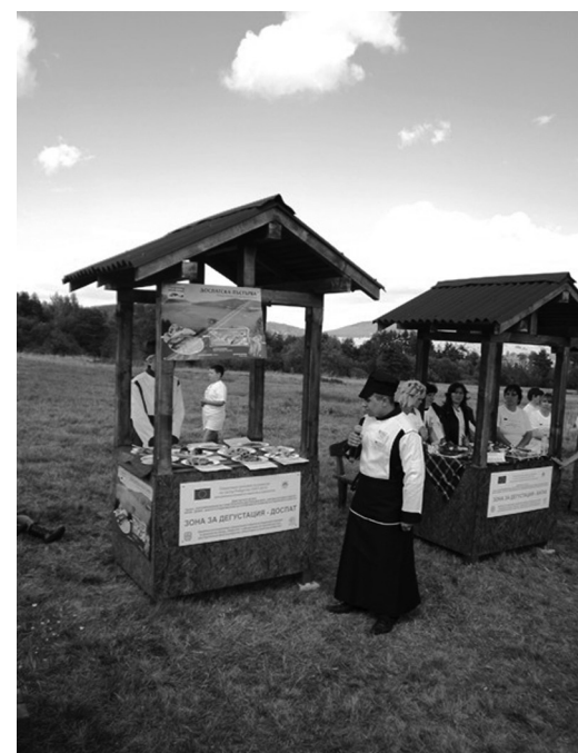
Снимки от провелото се Второ Фестивално събитие в Община Батак