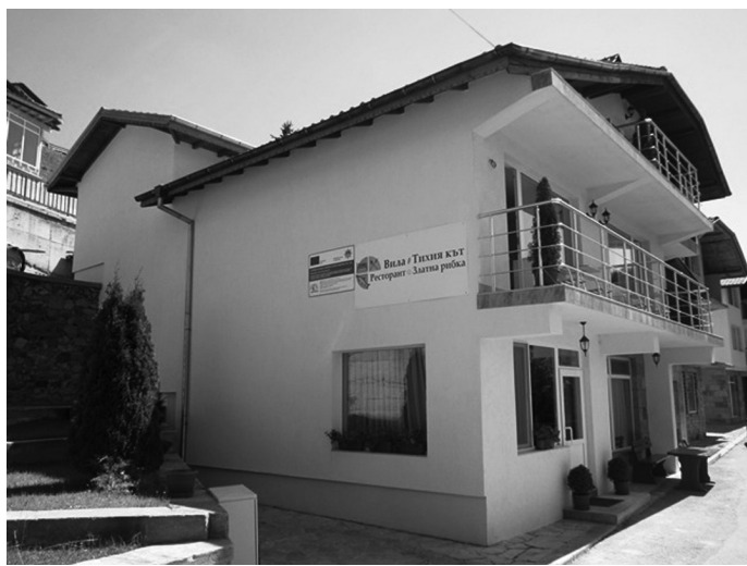
Снимки от изградения Рибен ресторант в град Доспат, предлагащ специализирани рибни менюта с фокус върху пъстървата, произведена в Рибарската област