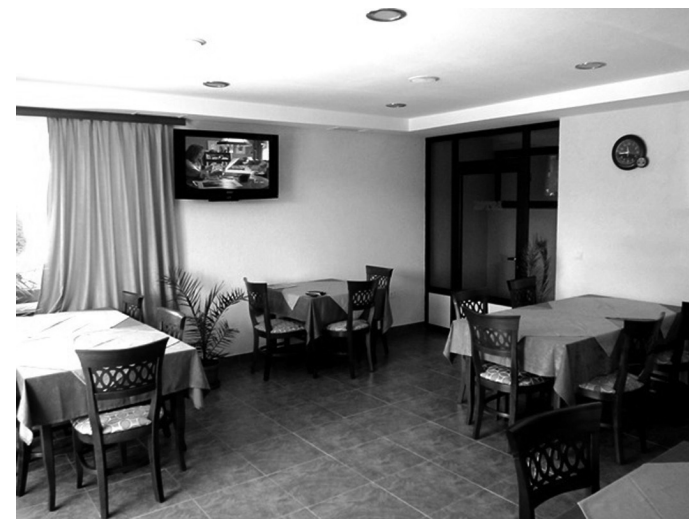
Снимка от ресторант „Златна рибка“ – град Доспат