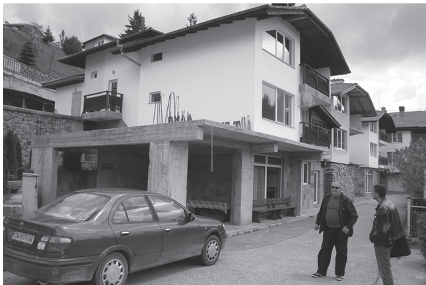
Мястото, където ще бъде изграден Рибния ресторант в град Доспат

МЯСТО НА ИЗПЪЛНЕНИЕ В РИБАРСКАТА ОБЛАСТ: Област Смолян, Община Доспат, град Доспат, язовир Доспат