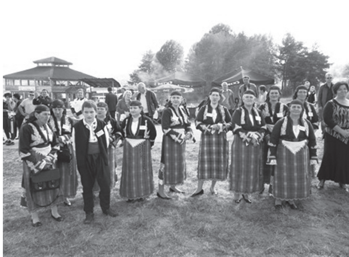
Първо фестивално събитие в град Батак, 13-14 октомври 2012 г.