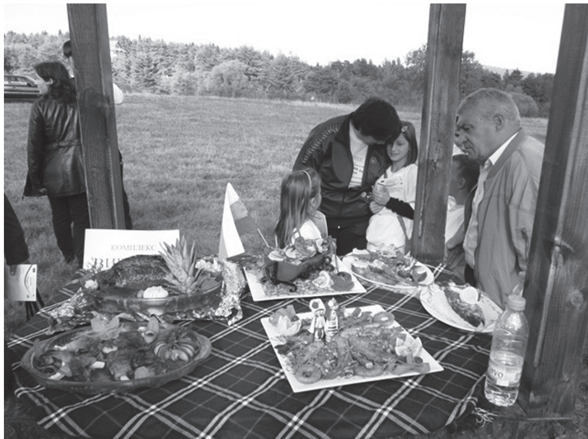
Дегустация на рибни специалитети по време на Първото фестивално събитие на територията на к.к. „Язовир Батак“

КОНТАКТИ: Петър Паунов, град Батак, пл. „Освобождение“ № 5, тел. 03553/ 22-60