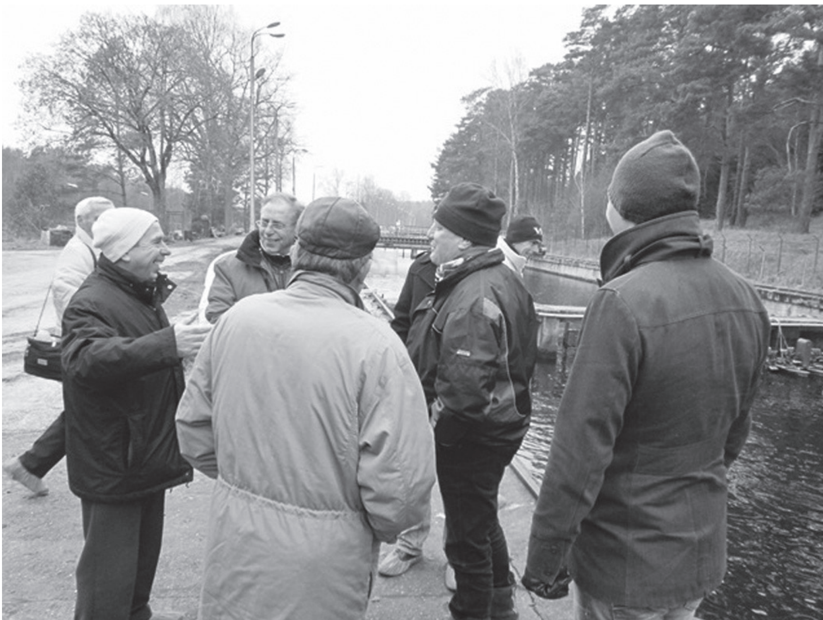
Посещение в Полша за обмяна на опит, 2-7 декември 2012 г.

В периода 02 - 07 декември 2012 г. представители на МИРГ „Високи Западни Родопи: Батак-Девин-Доспат“, включващи членове на Управителния съвет (УС), Общото събрание (ОС), изпълнителния екип и един представител на Управляващия орган (УО), посетиха местни инициативни рибарски групи в Полша. Целта на посещението беше запознаване с опита на МИРГ в Полша относно прилагане на местни стратегии за развитие и реализиране на конкретни проекти. Повече подробности и снимки от учебното пътуване може да разгледате в сайта на МИРГ на следния адрес: www.flag-rhodope.bg