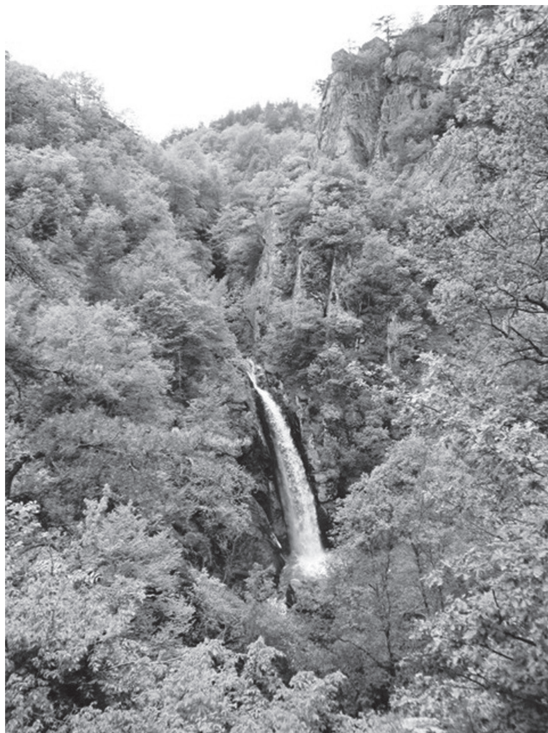
Фотинския водопад, намиращ се до с.Фотиново, община Батак

КОНТАКТИ: Алтънай Исов, с. Фотиново, община Батак, обл. Пазарджик, тел. 089 93 74 263