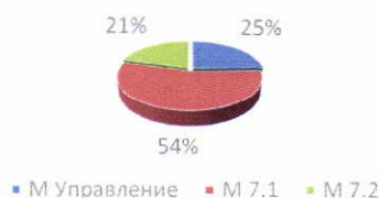
Структура на бюджета по мерки

голям относителен дял в рамките на стратегията е мярка 7.1 „Подкрепа за инфраструктура и услуги, свързани с малките рибарски стопанства и туризма, в полза на малки рибарски общности“ ще подкрепи подобряването на облика на